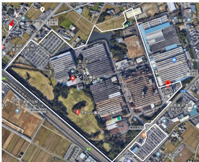
【物理的境界】 本社・本社工場、アイシン高丘エンジニアリング (株)